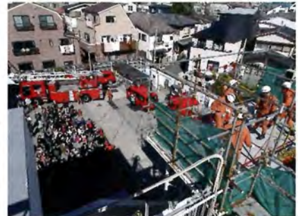
特別救助隊の訓練披露