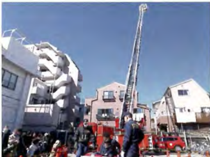
はしご車搭乗体験