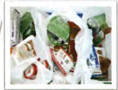
↑お渡しした応援パック↑