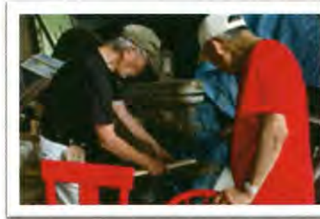
↑赤い椅子をメンテナンスしているときの様子↑

皆様の善意のおかげで活動を維持継続することができ、椅子の安全を確保することができました。ありがとうございます。