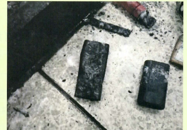
モバイルバッテリーの焼損状況